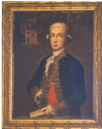
Cronista y Rey de Armas