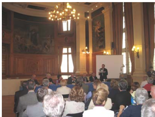
Apertura del IV Colloquio di Genealogia

Lunedì 10 ottobre 2005, nella mattinata si è tenuta la riunione del Bureau dell'Accademia Internazionale di Genealogia . Alle ore 14,00 è stato aperto ufficialmente il Colloquio dal presidente Michel Teillard d'Eyry ,