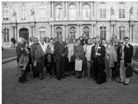
Visita agli Archivi