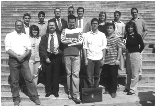
I partecipanti alla 1ª visita araldica guidata

A fronte di un minimo contributo a copertura delle spese sostenute per la