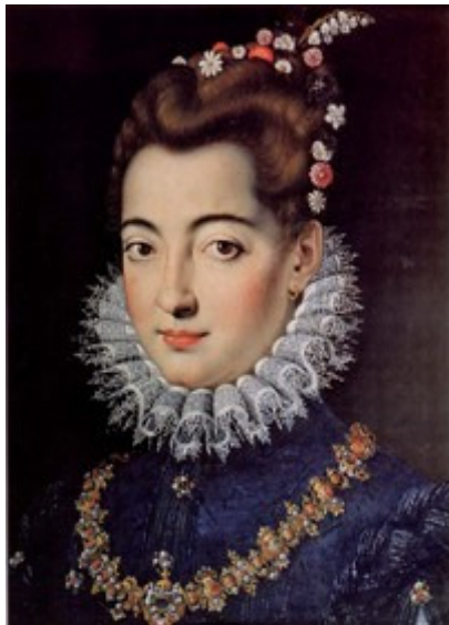
Clelia Farnese Cesarini (1556 ca. - 1613)

Ore 09.15: Alfredo MAULO (Curatore del Sito www.ducatocezarini.it ): L'investitura feudale di Giuliano I Cesarini e l'esproprio dei Palazzi dei Priori di Civitanova e Montecosaro alla metà del Cinquecento.