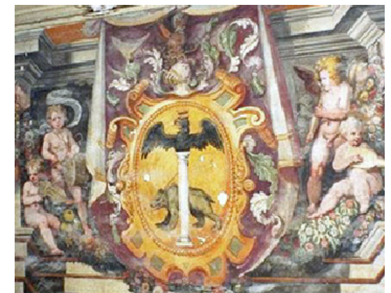
Stemma Cesarini, Sec. XVI

Montecosaro (MC) , Teatro delle Logge, Piazza Trieste n. 11