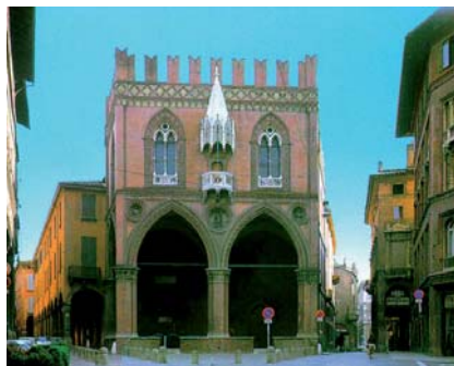
Palazzo della Mercanzia - Bologna

“L’utilità dello studio del patrimonio familiare nella ricerca genealogica”.