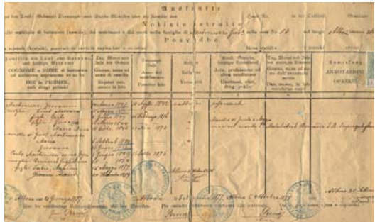
Certificato di stato civile in 3 lingue, 1877

La redazione del libro della storia di famiglia.