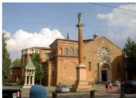
Chiesa di San Domenico - Bologna

Via Battisti, 3 - 40123 Bologna - Italia